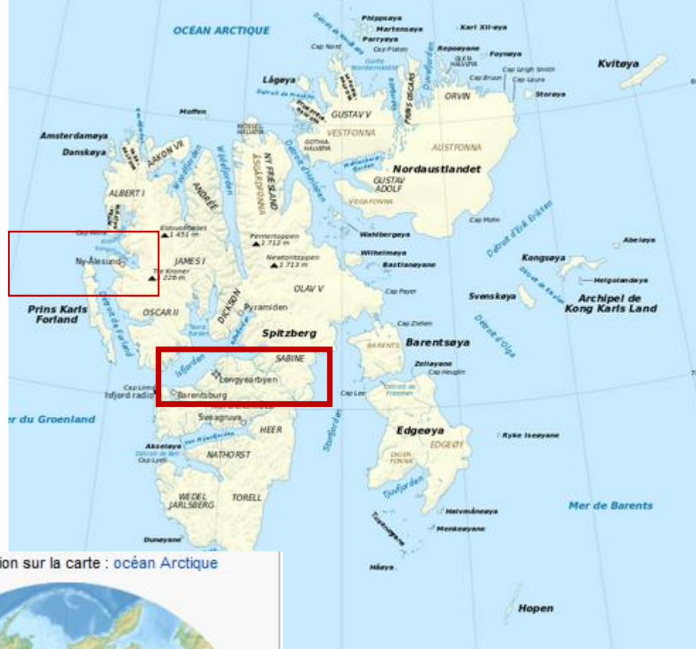
Géolocalisation sur la carte : océan Arctique