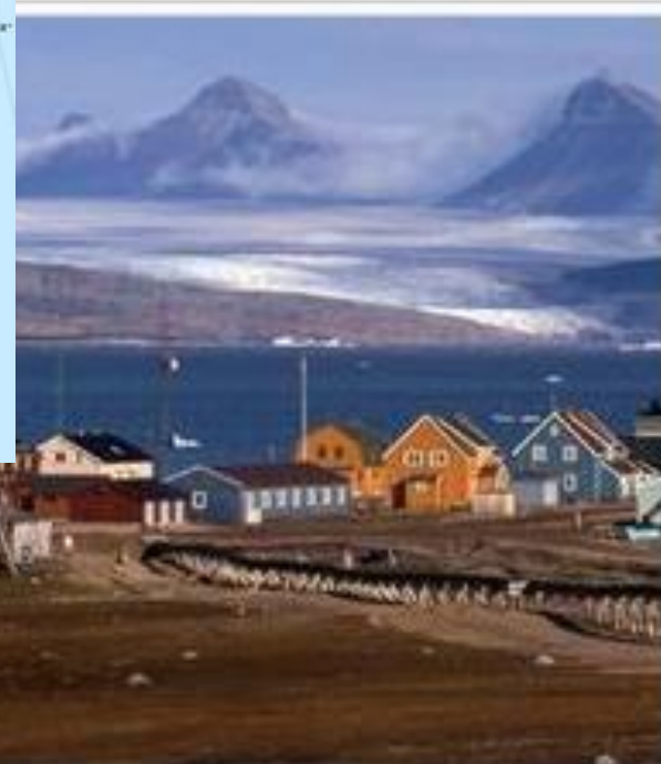
Ny-Ålesund sur la côte ouest de l'île de Spitzberg.