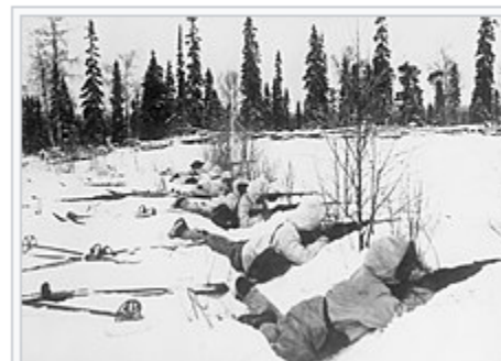
Troupes à ski finlandaise pendant la guerre d'Hiver.

La Suède et le Danemark se combattirent durant plusieurs guerres au cours des xvi e et xvii e siècles. Comme une grande partie du Danemark se compose d'îles, il était généralement à l'abri des invasions, mais en janvier 1658, la plupart des eaux danoises gelèrent. Charles X Gustave de Suède mena son armée à travers la marche des Belts pour assiéger Copenhague . La guerre prit fin avec le traité de Roskilde , un traité très favorable aux Suédois.