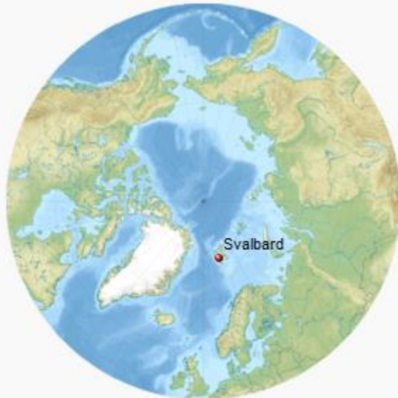
Archipels de Norvège